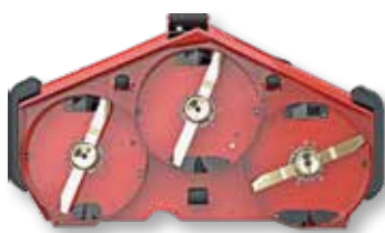
(A) (B) (C)

Toros Recycler®-teknik arbetar för att bearbeta klippet så att det blir fint nog att filtreras ner i gräset, istället för att bara släppa det ovanpå gräset. Toro Recycler®-klippare är särskilt konstruerade för att hantera stora klippvolymmer. Patenterade gräsplåtar och specialutformade knivar maximerar luftflödet och förvandlar gräsklippet till fina strimlor. Slutresultatet är en renklippt gräsmatta utan att du behöver samla upp gräsklippet och näringsämnena och fukten i klippet återförs till gräsmattan.